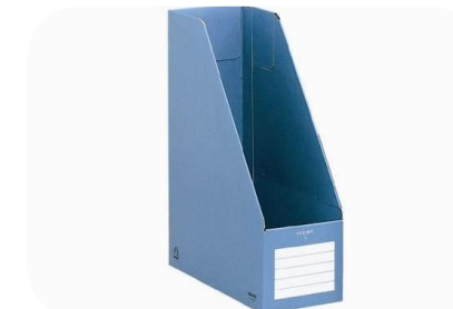
ファイルボックス・バインダー類(紙製)