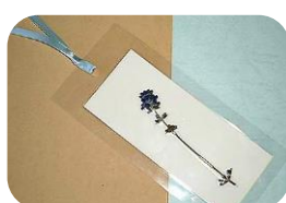
ラミネート加工済用紙