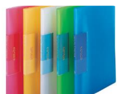
クリアブック・バインダー (プラスチック)