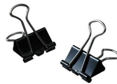
ゼム、ダブルクリップ・ピン・ホチキス針 (金属類)