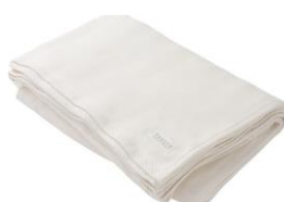
布・鉄板・CD等の紙以外のもの