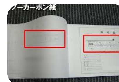
複写用紙(ノンカーボン紙)・使用済み宅配伝票