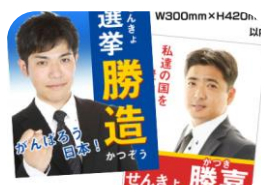
合成紙 (選挙ポスター等)