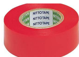
ビニール・布テープ類