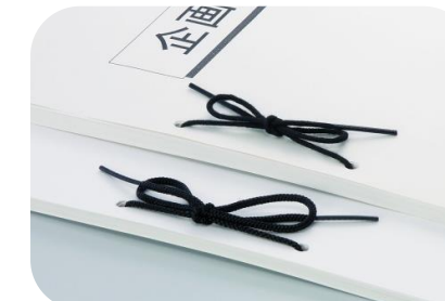
綴り紐・輪ゴム・ビニール紐・ガムテープ