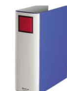
紙製のキングファイル